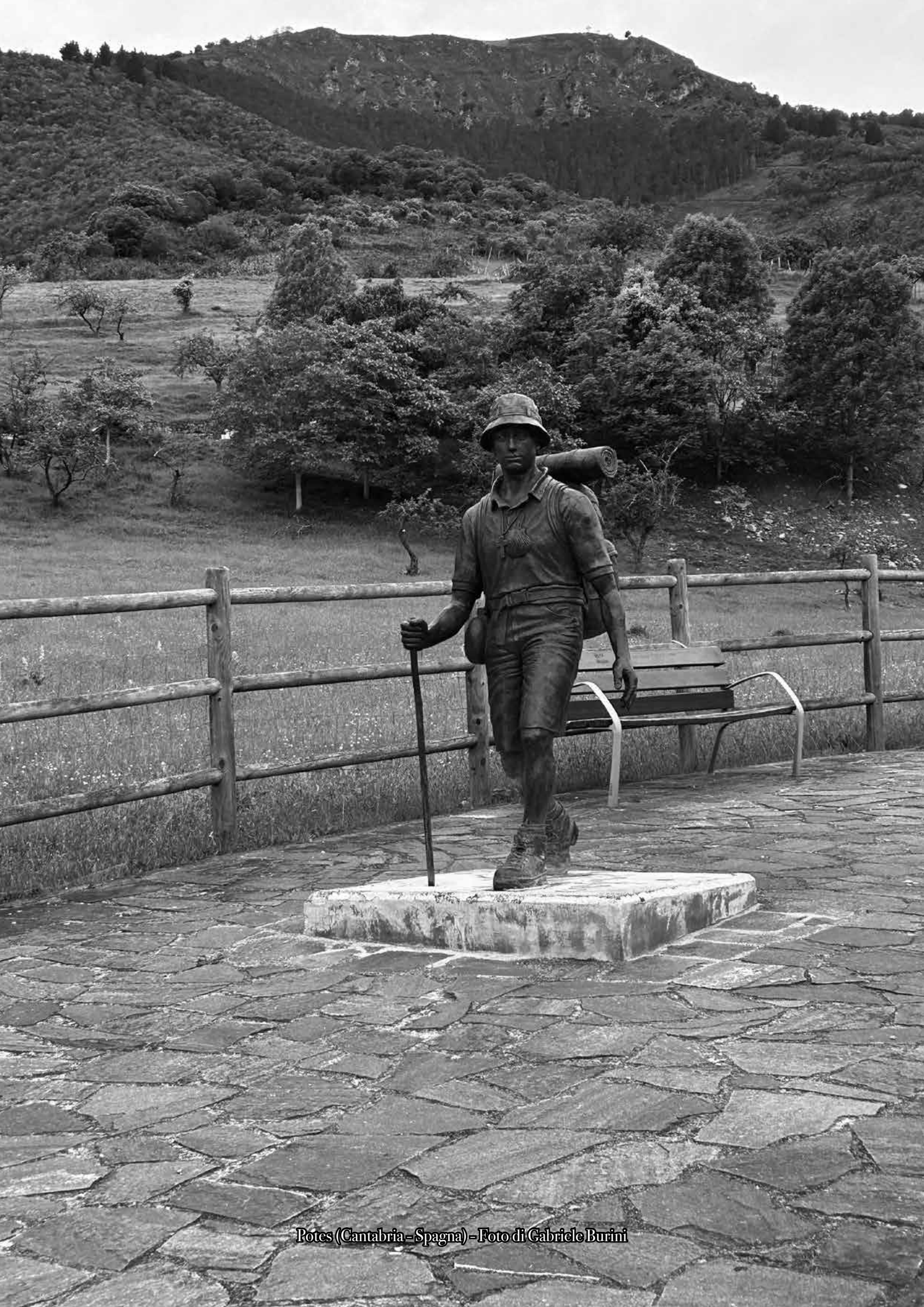
Potes (Cantabria-Spagna)