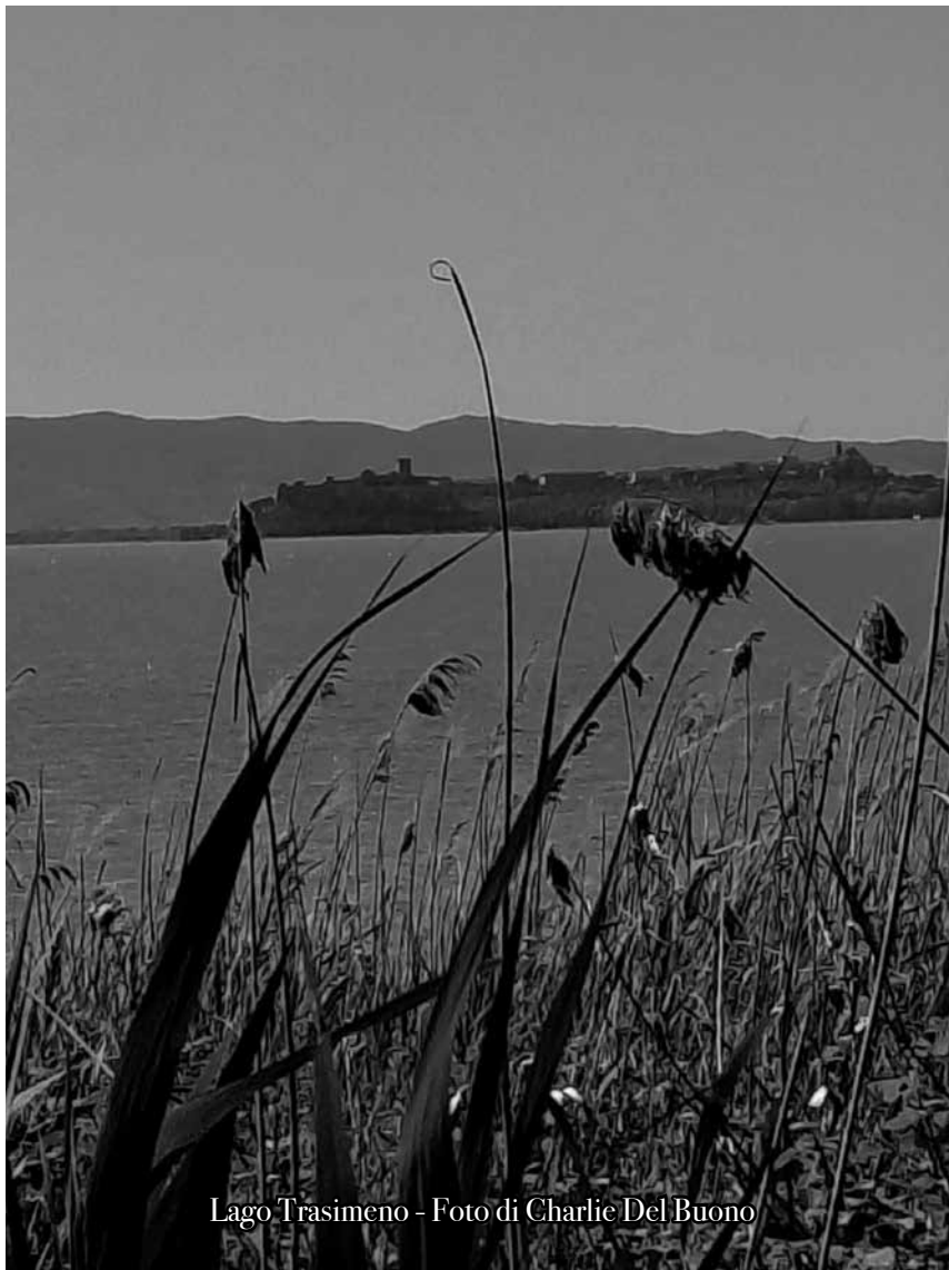
Lago Trasimeno

Perché dare dignità al dolore significa anche aprire possibilità di rinascita.