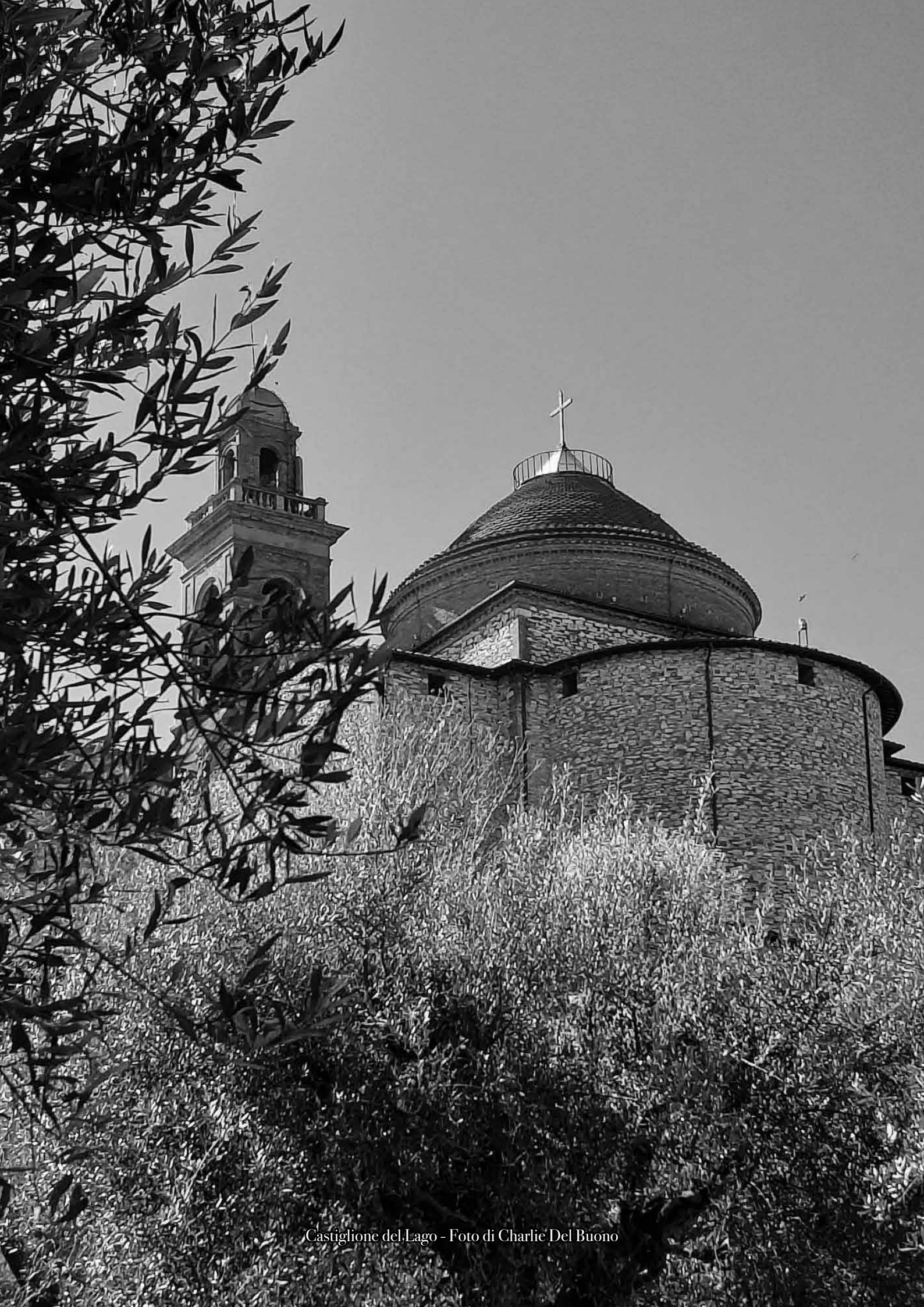
Castiglione del Lago - Foto di Charlie Del Buono