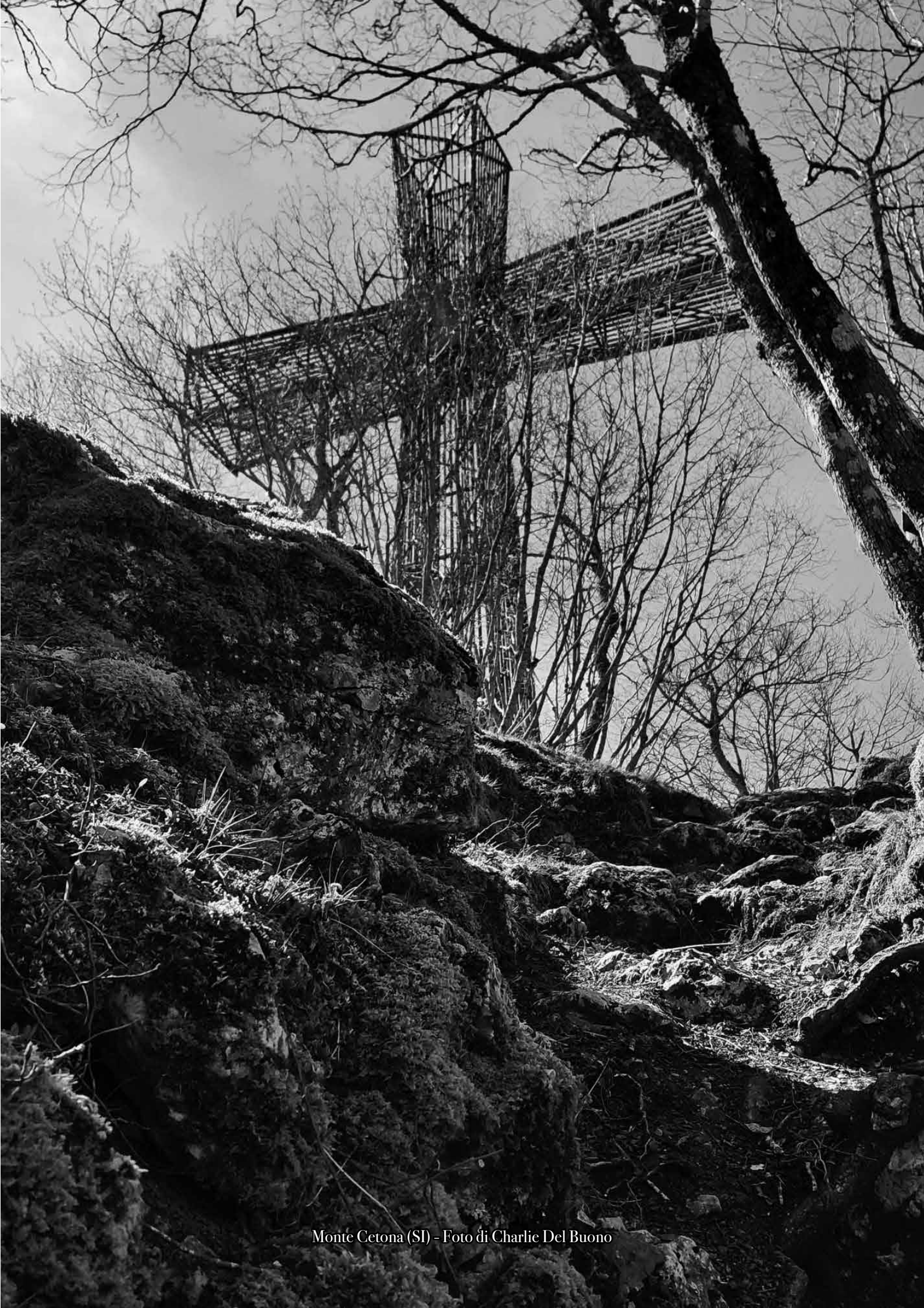
Monte Cetona (SI)