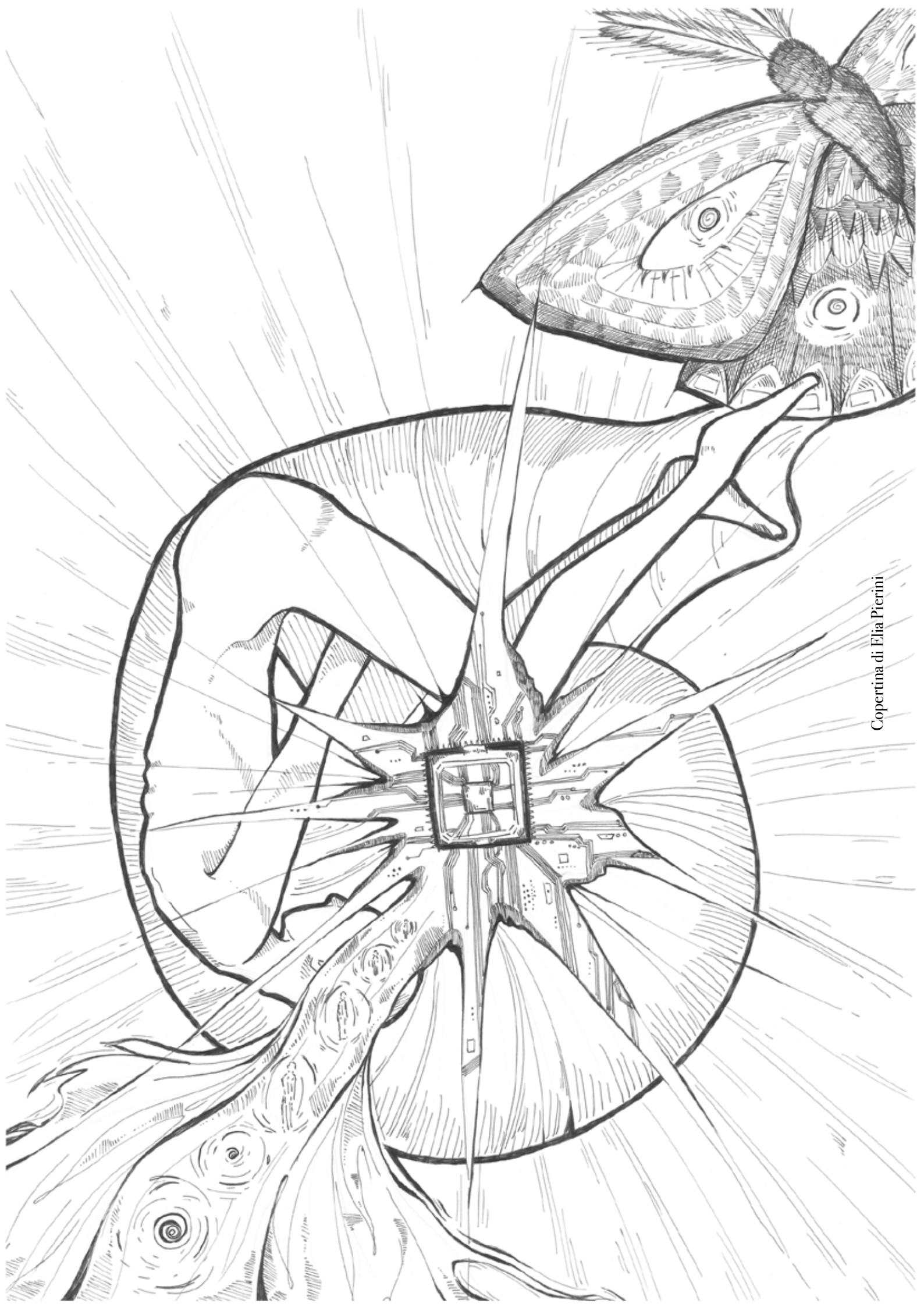
Copertina di Elia Pierini