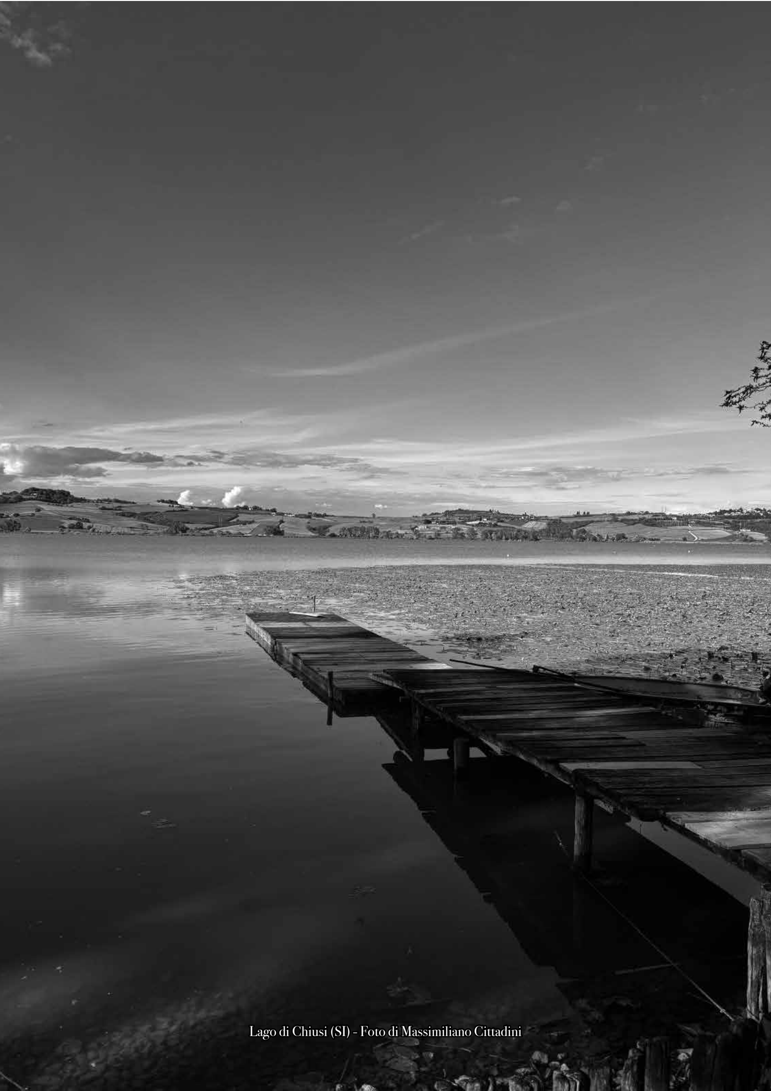
Lago di Chiusi (SI)