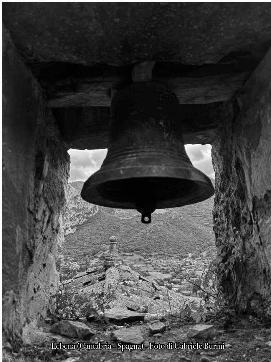
Lebena (Cantabria - Spagna)