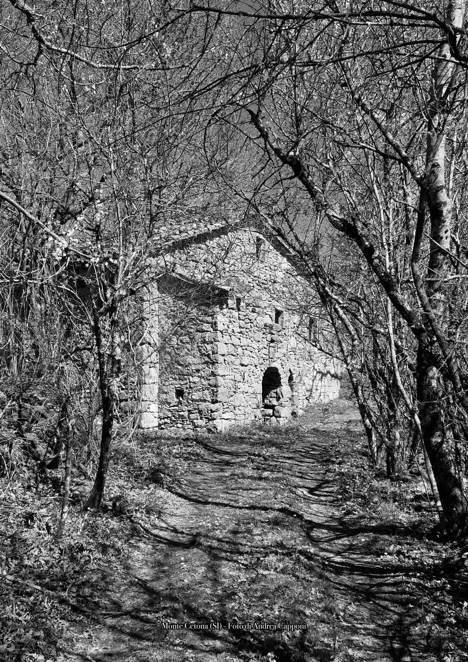
Monte Cetona (SI)