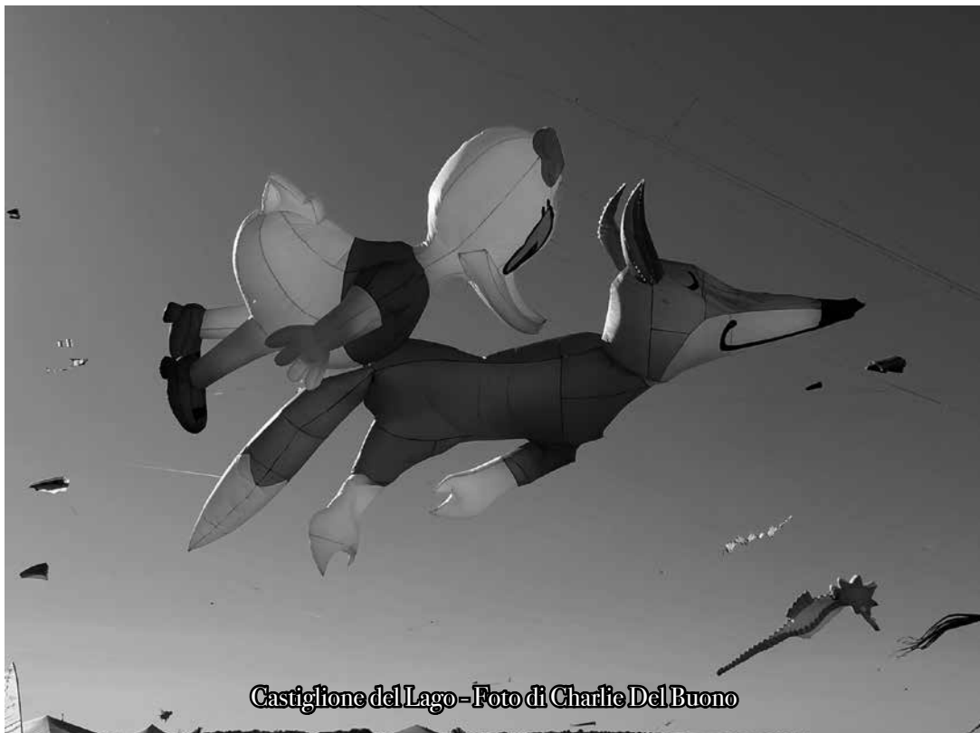
Castiglione del Lago - Foto di Charlie Del Buono

Il suo cammino era terminato, e lui "Sentiva" di essere arrivato finalmente a casa!